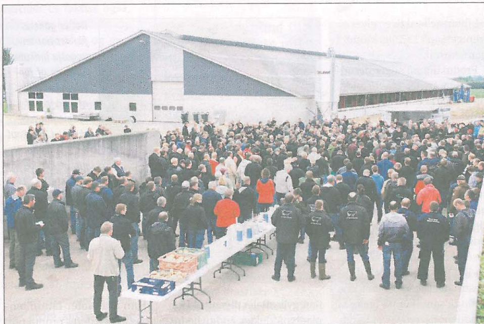
To bedrifter i Himmerland er værter for Grovfoderekskursion 2012, hvor deltagerne blandt andet kan høre om økonomi i dyrkning og fodring med proteinafgrøder på økologiske og konventionelle bedrifter og se et gårdanlæg til toastning af proteinafgrøder.

Markplanen på I/S Grøndalsgaard omfatter 336 hek-